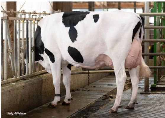
PROGENESIS ZAZZLE PRACTICE GRANDDAM