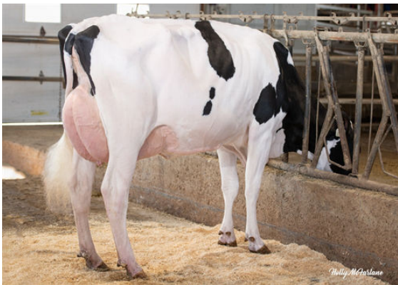
PROGENESIS JALAPENO PEPPY DAM